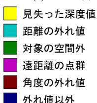
図 1. 用いた RGB データと位置合わせの結果得られた ICP の外れ値。(a) 動いている物体が写った RGB 画像。(b) 対応する ICP の外れ値。(c) 外れ値の区分を表すカラーマップ。距離の外れ値 (緑がかかった青色) が提案手法で用いた外れ値。