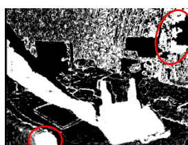
(b) ICP の外れ値