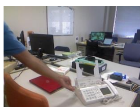
(a) RGB フレーム

ここでの結果は、遠距離にある点群や角度、空間に関する外れ値を除いたほうが、前景のセグメント化のプロセスは、時間、質ともに向上することを表している。さらにここでは、グラフカットといったグラフ理論を用いた抽出画像の洗練化手法も意味がないことも確かめた。現在は、物体が動き始めてすぐに静的な環境からセグメント化できるように研究を進めている。