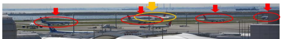
Fig.1 Congestion at around 8:00 a.m. (five aircrafts are queuing up).