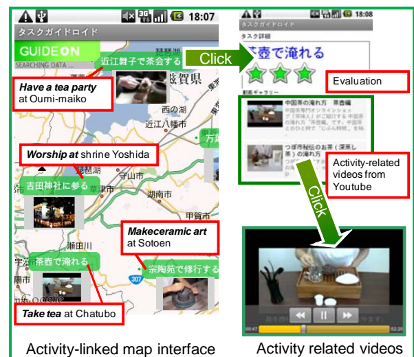
Fig.1 構築した行動モデルを用いた行動ナビ