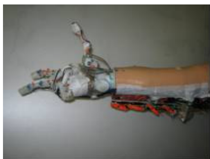
Fig. 1 EMG controlled Prosthetic Hand