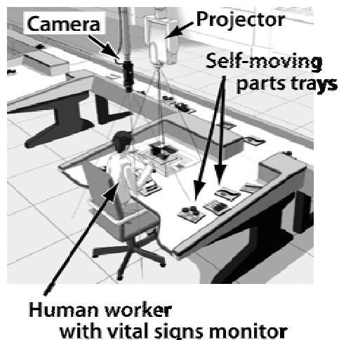
Fig. 1 Overview of Attentive Workbench