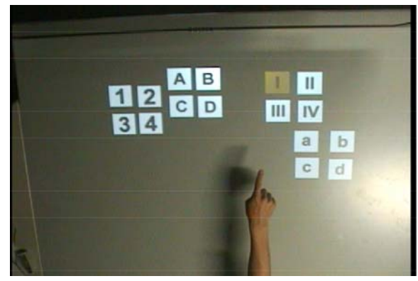
Fig.3 Target estimation based on pointing gesture